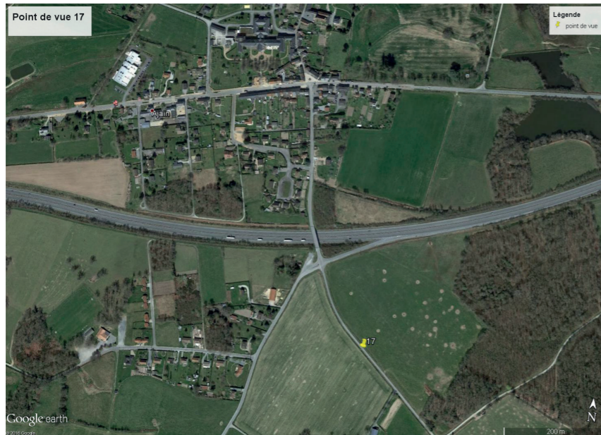
Contexte du point de vue (éoliennes non représentées)